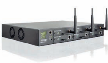
Viprinet Multichannel VPN Router 1610: